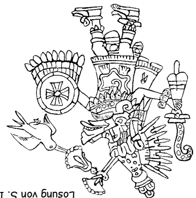
Lösung von S. 1

Und kannst du selbst Bild-Schriftzeichen erfinden?